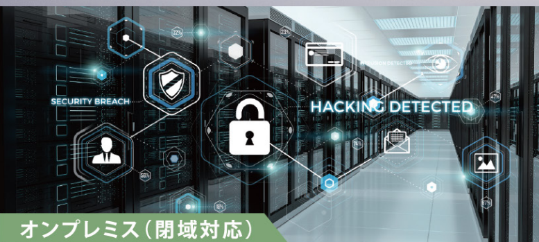
オンプレミス（閉域対応）