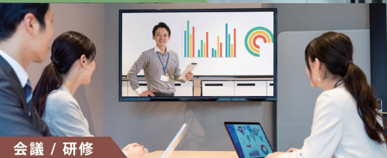
会議 / 研修