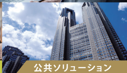
公共ソリューション