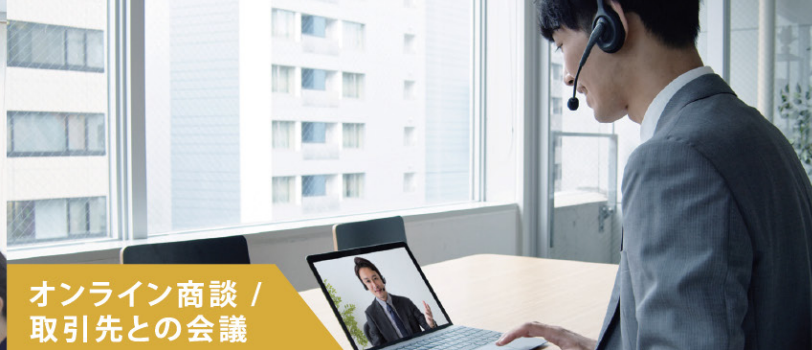
オンライン商談 / 取引先との会議