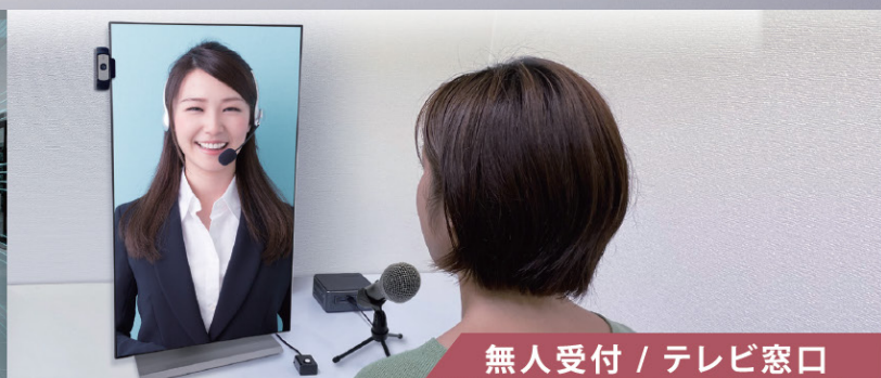
無人受付 / テレビ窓口