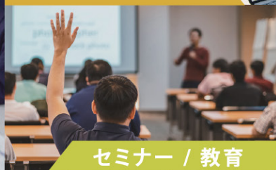
セミナー / 教育